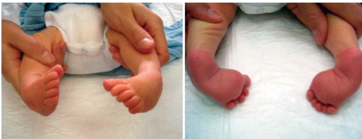
Figura 2. Imagen de unos pies zambos con las 4 deformidades que los caracterizan.

La deformidad tiene 4 componentes clave que se recuerdan por el acrónimo CAVE: el mediopié tiene un arco alto (cavo), el antepié está desviado hacia adentro (aducto), el talón está desviado hacia adentro (varo) y el retropié apunta hacia abajo (equino) (Figura 2). La deformidad es bastante rígida (no se corrige fácilmente con una manipulación suave) y el pie y la pantorrilla pueden ser ligeramente más pequeños que el lado opuesto normal.